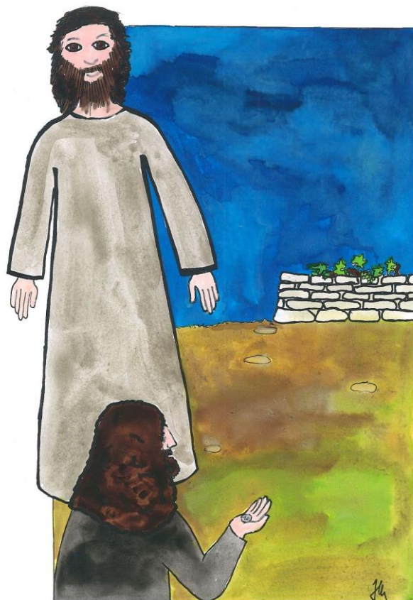
25. neděle v mezidobí cyklu A Mt 20,1-16a