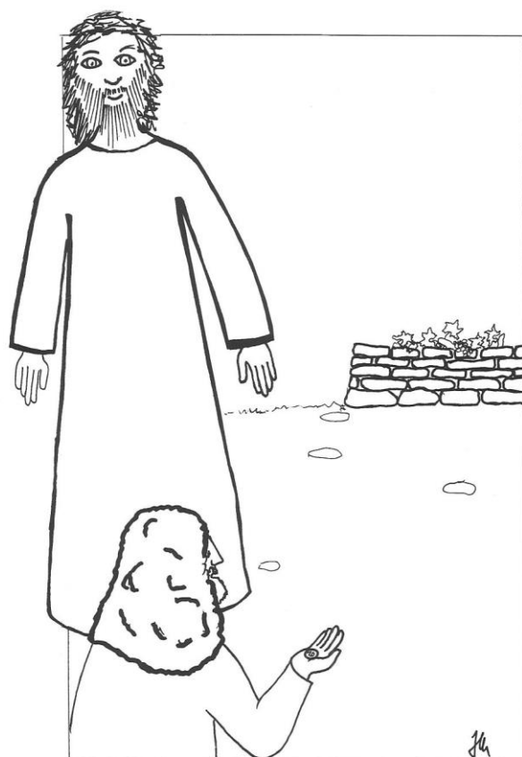
25. neděle v mezidobí cyklu A Mt 20,1-16a