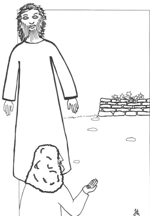
25. neděle v mezidobí cyklu A Mt 20,1-16a